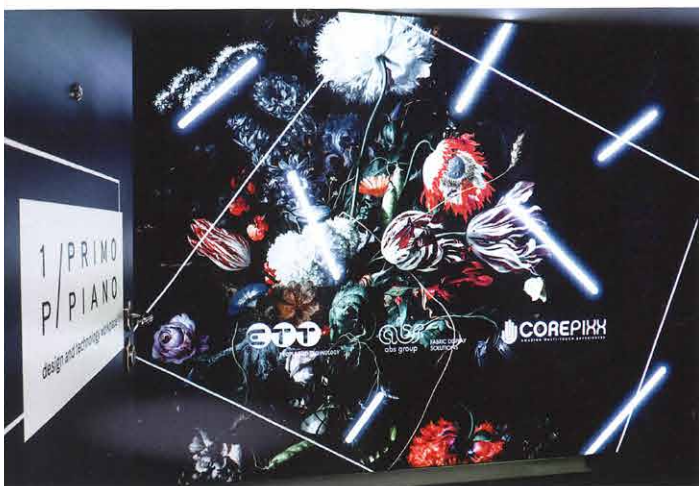
Bei der Dynamic White Light Box erfolgt die Hintergrundbeleuchtung über LED-Module, die in den Stoffstrukturen installiert sind. Die Bewegungen der Lichter sind so programmiert, dass sie bestimmte Bereiche der gedruckten Grafiken hervorheben und verschiedene visuelle Effekte erzeugen.

Ein Raum – viele Gestaltungsmöglichkeiten: Das bietet das Showroom-Konzept 1P/Primo Piano. Durch die Kombination von Aluminium und Stoffen mit Technik und Interaktion wird ein Erlebnisraum geschaffen.