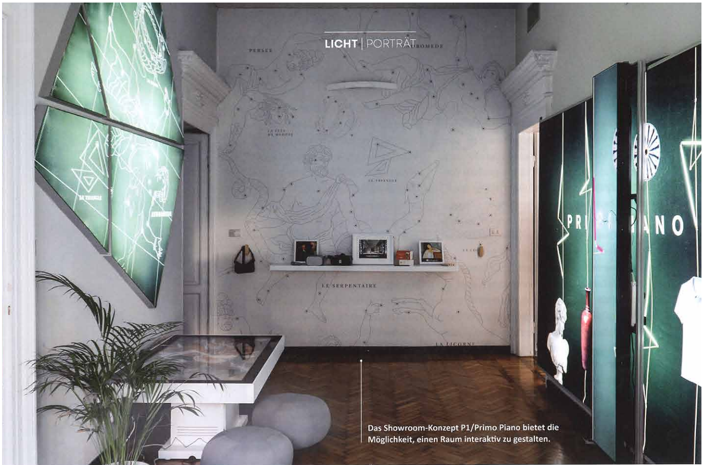
Das Showroom-Konzept P1/Primo Piano bietet die Möglichkeit, einen Raum interaktiv zu gestalten.