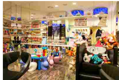
Coppolino è un progetto dedicato alla 'bellezza dei bambini per i bambini'

Addentrando nell'atelier si accede quindi alla seconda sezione, l'area Hair&Beauty , dove un nutrito team di giovani hair stylist è pronto a offrire i servizi unici firmati Aldo Coppola, impiegando i phon Dyson Supersonic . Spiccano, in salone, grandi specchi a forma di cuore e le farfalle ecolighting di Catellani&Smith . Nell'area rivestita in teak, sono invece i gentleman a poter godere del servizio barberia e di altri trattamenti mirati. Con l'inaugurazione dell'atelier, Aldo Coppola ha lanciato inoltre il progetto 'Coppolino' , avente per logo un colorato palloncino. Si tratta di un servizio dedicato alla 'bellezza dei bambini per i bambini' , dove ci si prende cura dei più piccoli in uno spazio ludico , pieno di colorati confetti della Confetteria Conti , arredato con le Rabbit Baby Chair di Qeeboo e disseminato di giochi magnetici Geomagworld . Al 'Coppolino' , mentre si concede un trattamento, la cliente può anche far accudire il proprio bambino: il servizio di baby sitting è dispensato da volontarie di associazioni non profit impegnate a favore dei bambini meno fortunati. Il ricavato del servizio viene devoluto da Aldo Coppola proprio all'associazione coinvolta in quel momento (la prima a beneficiarne è la Fondazione Francesca Rava , altre ne seguiranno).