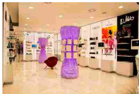
Nell'area fast retail trovano spazio brand cosmetici, di design e di food

Un'esperienza a tutto tondo all'insegna della bellezza e del glam, con un occhio di riguardo alla solidarietà. Mira ad accarezzare tutti i sensi l'atelier Aldo Coppola inaugurato da pochi giorni al primo piano del Brian&Berry Building di Milano: nel suo nuovo spazio di 400 mq , progettato da Aldo Coppola Jr. di concerto con l'architetto Anton Kobrinetz , il brand che da decenni su scala mondiale è sinonimo di hair styling di lusso ha voluto riunire marchi italiani e internazionali di cosmesi, design e alimentazione , contraddistinti da un comune denominatore: l'eccellenza .