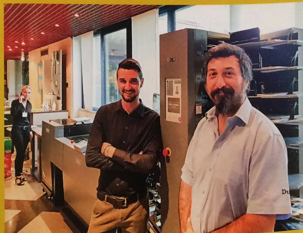
Duplo Booklet System 600i (nella foto alle spalle del team Neopost) è stato uno degli highlight nell'ambito del finishing ai Digital Days insieme alla DC-646i Pro e alla brossa UltraBind 2000 PUR

a giocare un ruolo chiave sono state soprattutto le applicazioni, rese possibili grazie ai tanti sistemi di finishing proposti in partnership con Scodix, Zund e Neopost. Quest'ultima, vera protagonista con il suo dinamico team e con 4 diversi sistemi installati, ha mostrato tra l'altro le potenzialità del finisher multifunzione Duplo DC-646i Pro, in grado di effettuare lavorazioni di taglio, rifilo, cordonatura, piega, perforazione, microperforazione e mezzo taglio. www.neopost.it