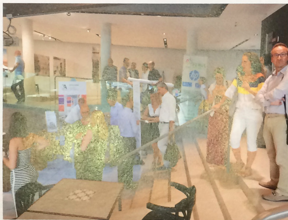
Alcuni dei visitatori all'interno dell'Ecoarea, in cui hanno scoperto anche i materiali rigidi prodotti da Ti-Vu Plast e 3A Composites, oltre ai plotter flatbed Valiani