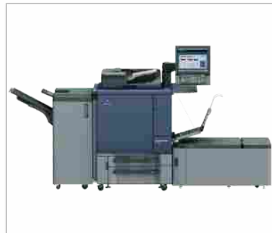
Accurio di Konica Minolta

Konica Minolta e SCREEN Graphic Solutions rafforzano la collaborazione nell'area della stampa digitale commerciale promuovendo i workflow ibridi per lo scambio dati tra EQUIOS e il portfolio Accurio . L'importanza dell'accordo consiste nel fatto che il workflow ibrido viene utilizzato sia per la stampa digitale, sia per la offset nella preparazione delle forme su CtP. Pertanto le due società giapponesi hanno implementato il JDF in maniera da scambiare i dati tra il workflow universale EQUIOS ai sistemi Screen e le stampanti inkjet Accurio di Konica Minolta.