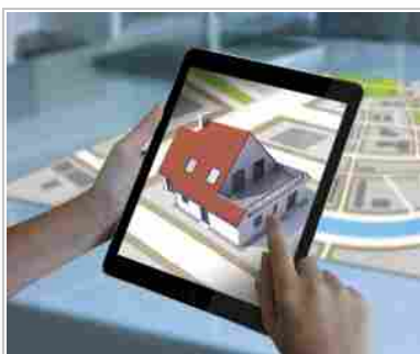
La Realtà Aumentata di Pikkart

Pikkart entra nel report di VDC Research, delle imprese di riferimento per lo sviluppo di soluzioni per la A.R. Pikkart, la startup modenese, è la prima in Italia – e tra le dodici al mondo – ad aver sviluppato un SDK, Software Development Kit, proprietario per lo sviluppo di soluzioni software in Realtà Aumentata (A.R.). L'ambita segnalazione arriva da VDC Research, società internazionale con sede negli USA, che si occupa di ricerca e analisi delle tendenze di sviluppo dell'economia con un'attenzione particolare per le nuove tecnologie. Di recente VDC Research ha